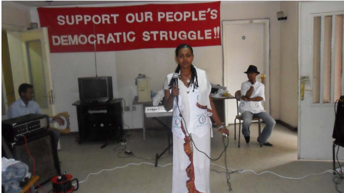
ጉድለ ባህሊ ግንባር ሃገራዊ ድሕነት ኤርትራ ኣብ ልምምድ ከላ።

ሲቪክ ማሕበራት፣ ምሁራት ውልቀ ሰባት፣ ናይ ሃይማኖት መራሕትን፣ ደቂ ኣንስትዮን፣ መንእሰያትን ናብ ኣዲስ ኣበባ በብመዓልቱ ዝኣትውሉ ሰዓት ኢዩ ዝነበረ።